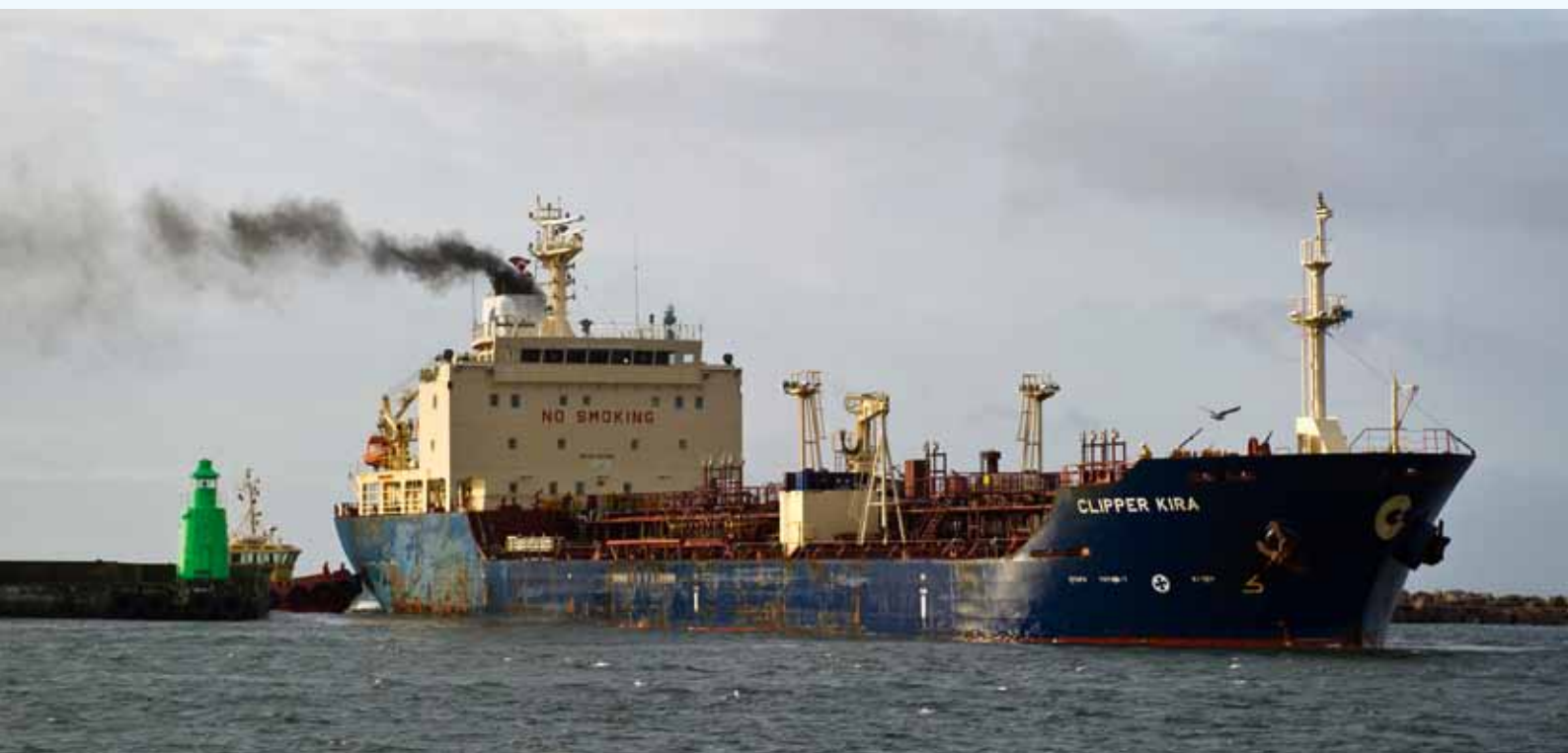
Det største skib med en ladning olie på mere end 7000 tons på vej ind i Skagen Havn.