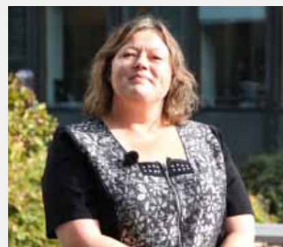
Den nye fødevareminister Mette Gjerskov har tidligere været fuldmægtig i Direktoratet for Fødevarer / Erhverv i Fødevareministeriet.

Der peges desuden på, at Danmark ofte står alene i EU-sammenhænge, da vi er EU's største producent og eksportør af fiskemel og fiskeolie. Endelig gøres opmærksom på, at FF Skagen med eksport til flere end 60 nationer opererer med basis i de højest opnåelige, internationale certifikater for energi, miljø og sporbarhed og i det hele taget arbejder og udvikler sig på et bæredygtigt grundlag.