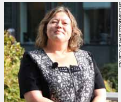
Den nye fødevareminister Mette Gjerskov har tidligere været fuldmægtig i Direktoratet for Fødevarer / Erhverv i Fødevareministeriet.

Der peges desuden på, at Danmark ofte står alene i EU-sammenhænge, da vi er EU's største producent og eksportør af fiskemel og fiskeolie. Endelig gøres opmærksom på, at FF Skagen med eksport til flere end 60 nationer opererer med basis i de højest opnåelige, internationale certifikater for energi, miljø og sporbarhed og i det hele taget arbejder og udvikler sig på et bæredygtigt grundlag.