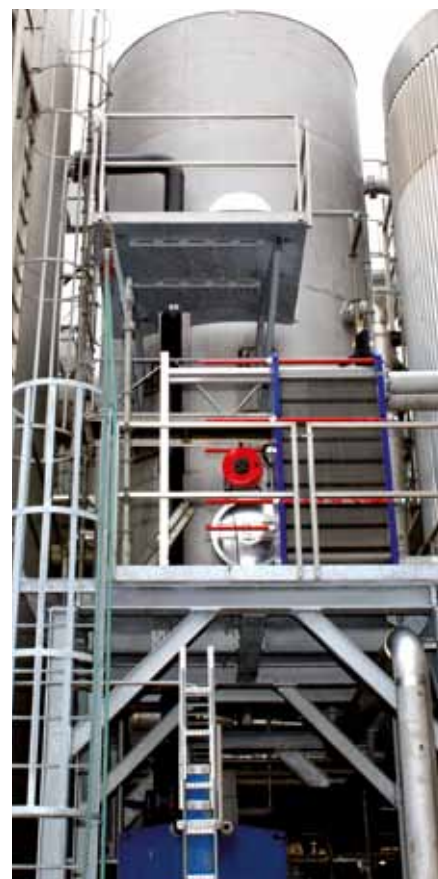
Denne nye beholder, fem meter høj og tre meter i diameter, er det fysiske billede på, at leverancen af overskydende restvarme fra FF bidrager til, at endnu flere husstande i Skagen får miljø- og energirigtig varme.

Sådan ser udviklingen ud skematisk de seneste fire år ved FF's aftale med Skagen Varmeværk.