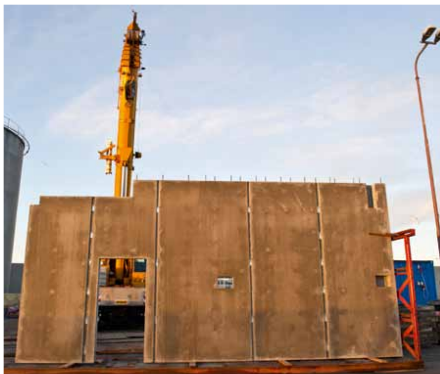
De første elementer er ankommet, og den ny administrationsbygningens profil er begyndt at vise sig.

Let og luftig og afstemt efter de omkringliggende bygninger. Overdækkede parkeringspladser i underetagen, medarbejdere i etagerne ovenover og en hovedindgang i en 14 meter høj bygning. FF's nye administrationsbygning giver et dynamisk udtryk, der samtidig signalerer lys og lethed i hvidt, sort og grålige nuancer på Havnevagtvej 5 i Skagen.