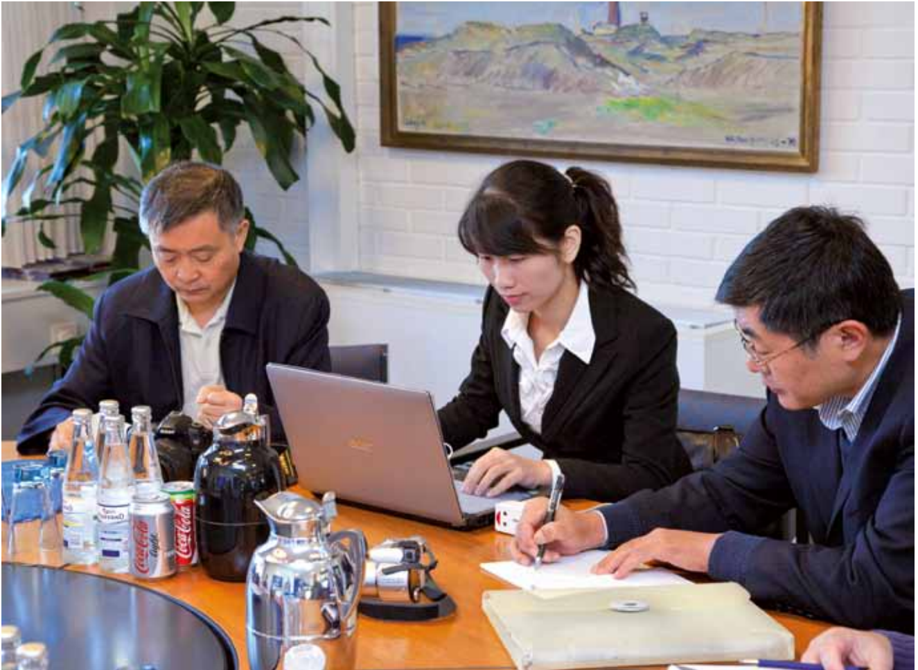
Den kinesiske delegation arbejdede grundigt under det fem timer lange besøg hos FF, og konkluderede: God ledelse med kvalitet og sikkerhed i top.