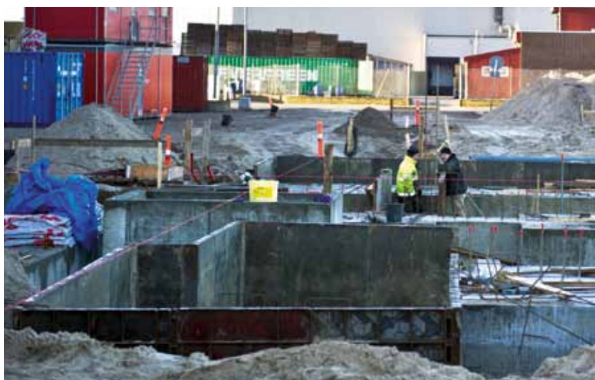
Fundamentet er klar, og alt er parat til at begynde byggeriet af de næste etager.

nytter os af i produktionen. Bygningen signalerer i mange henseender, at der er tale om en moderne fiskemøllefabrik, som også har sikret sig plads til at vokse. Arkitekt Jens Hansen, Frederikshavn, der har tegnet bygningen, fortæller, at udsynet